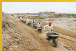
ACARREO DE MATERIAL EXCAVADO