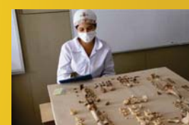
LIMPIEZA, ROTULADO Y REGISTRO DE MATERIAL MUEBLE