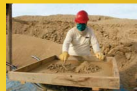
TAMIZADO DE MATERIAL CULTURAL