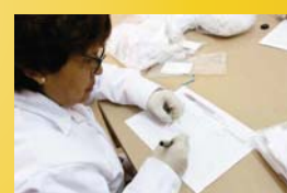
REGISTRO DOCUMENTAL Y ESCRITO