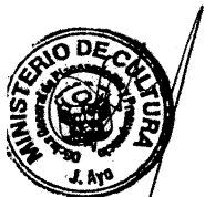
LUIS ALBERTO PEIRANO FALCONI Ministro de Cultura